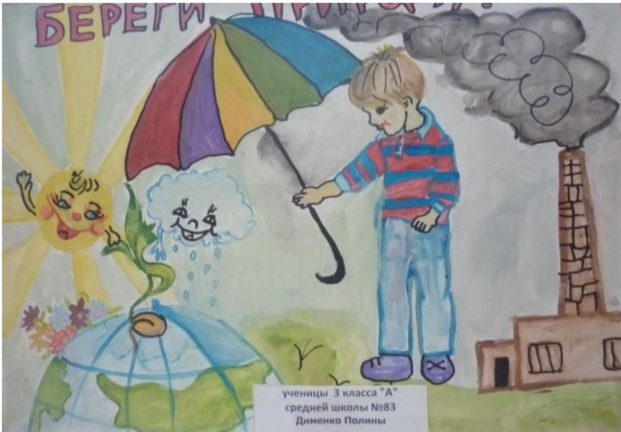
ученицы 3 класса "А" средней школы №83 Дименко Полины